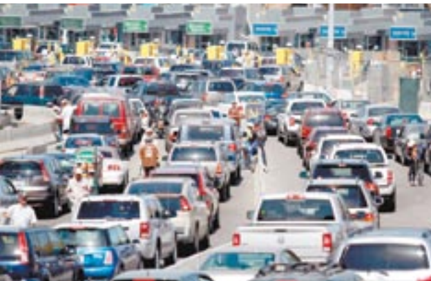
Las personas que quieren cruzar a Estados Unidos podrán consultar la cantidad de autos las 24 horas del día.